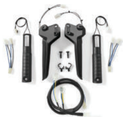
HEATED LEVER GRIP KIT 599 42 39-01